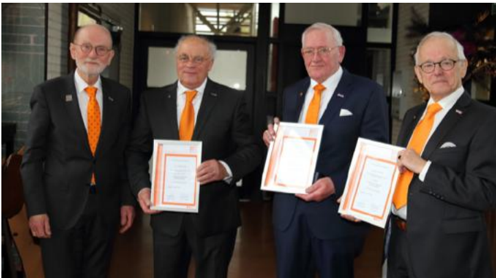
Penningen uitgereikt in Goor op 27 april 2024