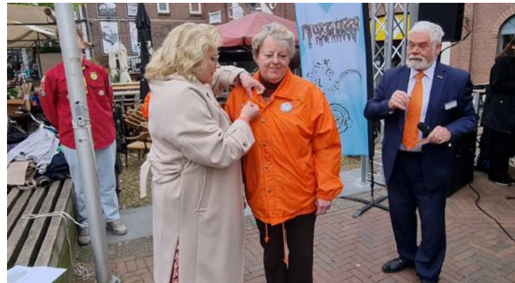
Penning uitgereikt in Geldermalsen op 27 april 2024