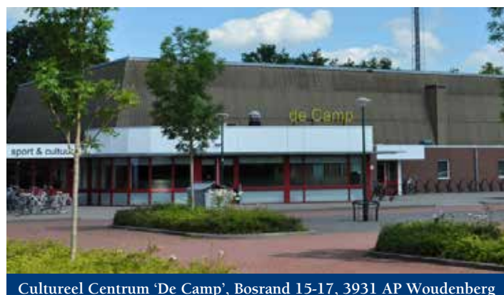
Cultureel Centrum 'De Camp', Bosrand 15-17, 3931 AP Woudenberg

Graag maak ik u attent op onze Algemene Ledenvergadering. Deze zal op zaterdagmorgen 24 maart 2018 vanaf 10.00 uur worden gehouden in Cultureel Centrum De Camp te Woudenberg. Via een mail zijn al onze leden op de datum geattendeerd en binnenkort komt de agenda met bijbehorende stukken uw kant op. Op de agenda staat onder andere een debat over ballonoplatingen en informatie over Buma/Stemra.