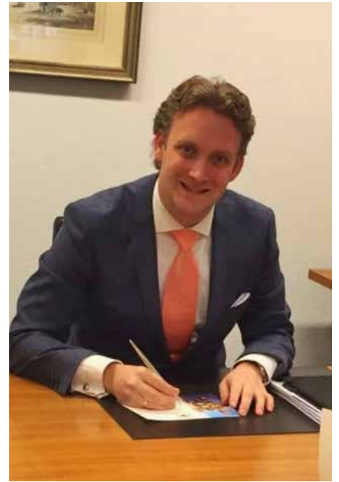
De kaart met de felicitaties voor Prinses Beatrix wordt geschreven.

(Het secretariaat van de KBOV heeft onlangs een bedankbrief mogen ontvangen vanuit het secretariaat van H.K.H. Prinses Beatrix n.a.v. de felicitaties bij gelegenheid van haar tachtigste verjaardag.)